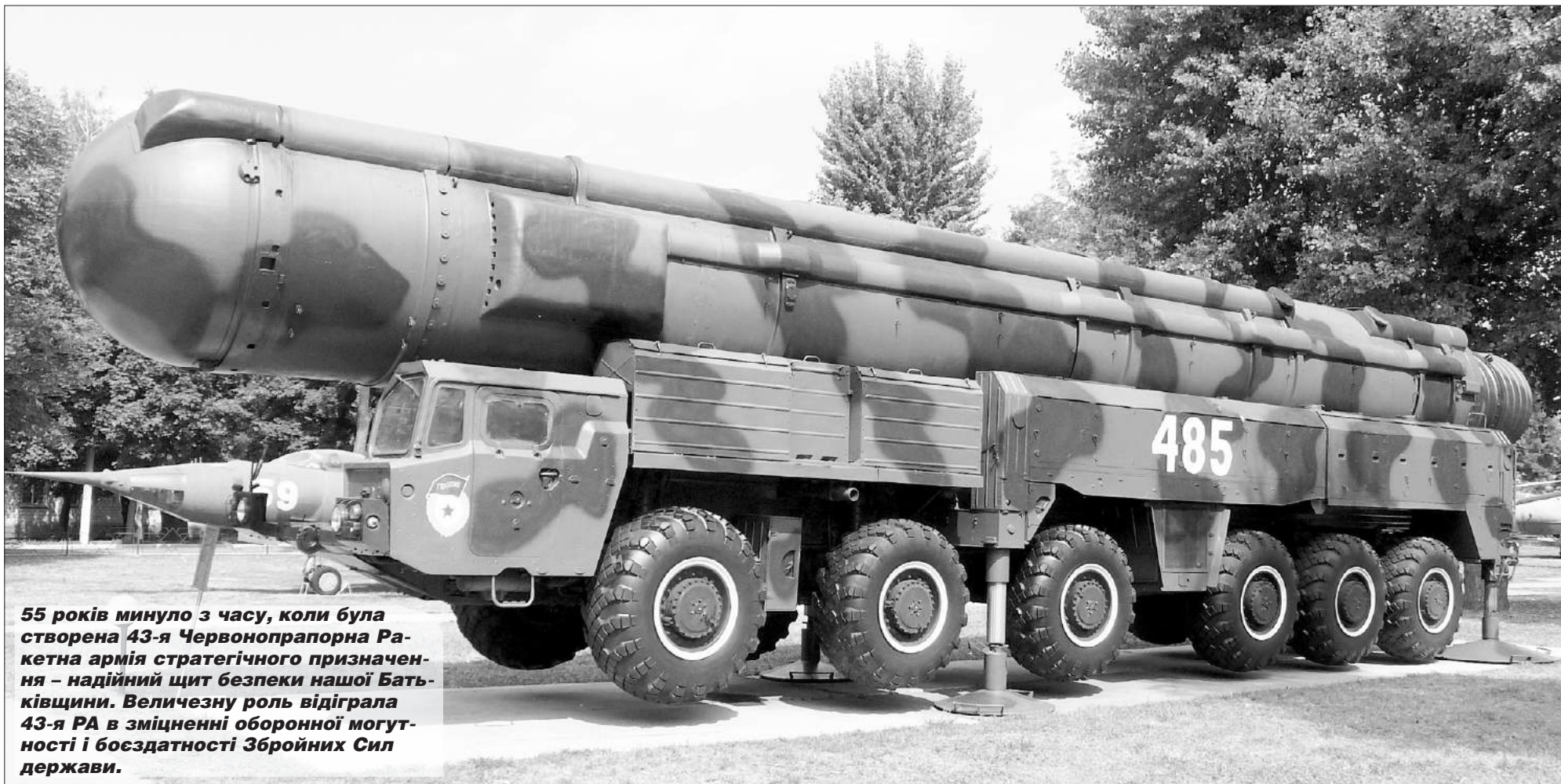
55 років минуло з часу, коли була створена 43-я Червонопрапорна Ракетна армія стратегічного призначення – надійний щит безпеки нашої Батьківщини. Величезну роль відіграла 43-я РА в зміцненні оборонної могутності і боєздатності Збройних Сил держави.